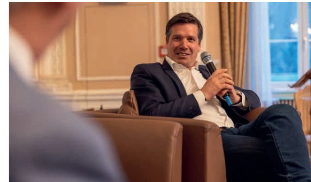
Bruno Kernen, Ex-Skirennfahrer und heutiger Geschäftsführer von Anavon Ski.