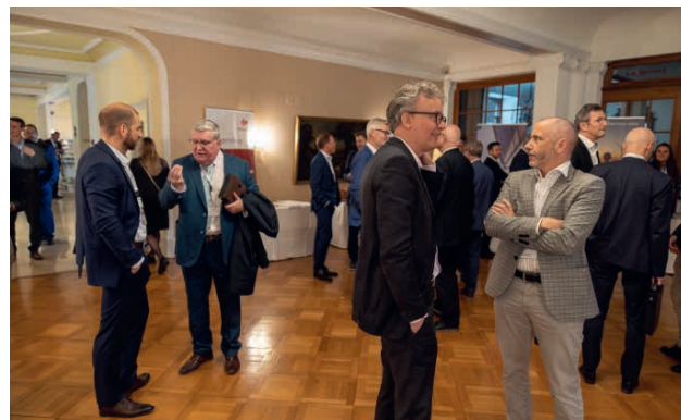
Get together bei den Ausstellungsständen am 10. Vorsorgeforum Interlaken.