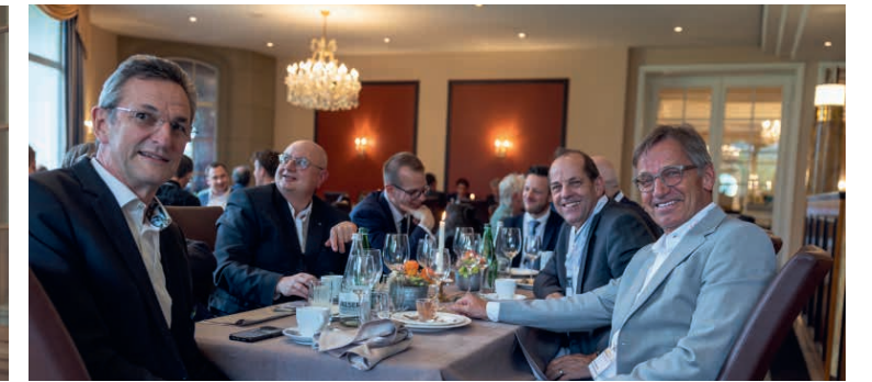
Gute Stimmung während des Dinners.